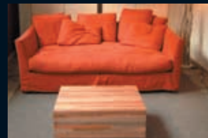
3 – Home Box, Reyndersstraat 12