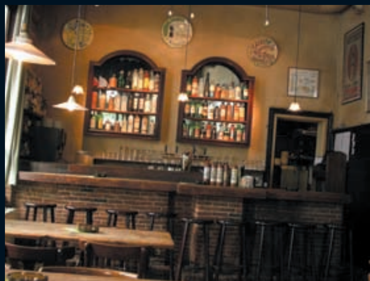
5 – De Vagant, Reyndersstraat 25