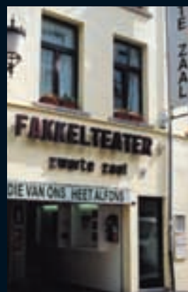
1 – Fakkelteater (zwarte zaal), Reyndersstraat 7