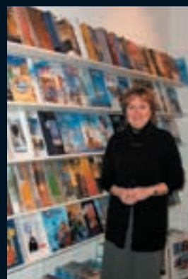
6 – DN Travel and Events, Reyndersstraat 27