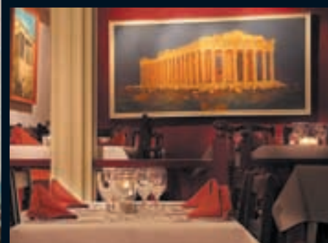
7 – De twee Atheners, Vlasmarkt 25-27